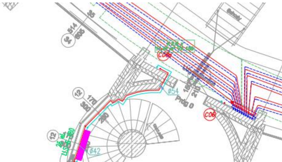
Rysunek 2 Lokalizacja, typ i wielkość grzejników.